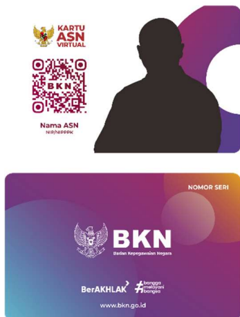
Kartu ASN Virtual bagi PNS